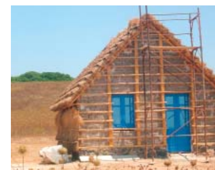
Parco Nazionale - Sardegna

Smalto lucido diluibile con acqua per laccature coprenti lucide per interno ed esterno. Adatto per legno e metalli ferrosi (trattare prima con antiruggine N° 234).